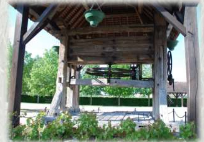
Pressoir de Machault

Souvent décrit comme « un village où il fait bon vivre », Machault est à la hauteur de sa réputation. Point de départ de cette randonnée, le village révèle un patrimoine rural témoignant du passé agricole et surtout viticole.