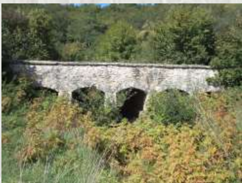
Le pont Vallerand

Le balisage de l'itinéraire que vous empruntez est réalisé et entretenu par les 250 baliseurs du comité départemental de la Randonnée Pédestre de Seine et Marne (Codérando 77). Il fait partie des 4500 km de chemins de promenade et de randonnée existant sur le département.