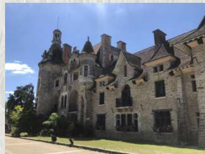
Le château des Dames

Agréable déambulation au travers le Châtelet-en-Brie, petite ville briarde dominant la source qui serait, il y a fort longtemps, la raison de son installation.